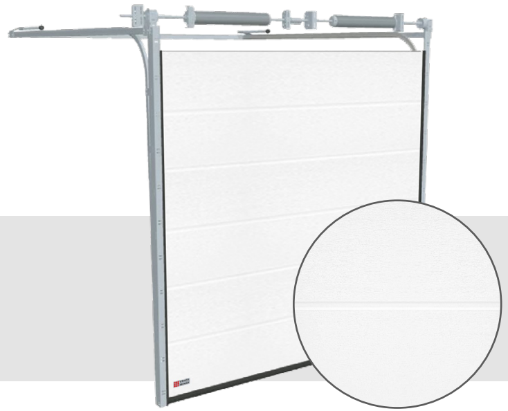
■ STŘEDOVÁ DRÁŽKA